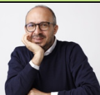
On. Davide Faraone

Deputato della Repubblica, già Sottosegretario al MIUR e al Ministero della Salute; è Presidente di FIA (Fondazione Italiana Autismo). È stato uno dei promotori della prima legge sull'autismo in Italia e della legge sul "Dopo di Noi". Autore del libro "Con gli occhi di Sara. Un padre, una figlia e l'autismo".