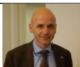
Prof. Lucio Cottini

Deputato della Repubblica, già Sottosegretario al MIUR e al Ministero della Salute; è Presidente di FIA (Fondazione Italiana Autismo). È stato uno dei promotori della prima legge sull'autismo in Italia e della legge sul "Dopo di Noi". Autore del libro "Con gli occhi di Sara. Un padre, una figlia e l'autismo".