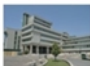
Albergo in Tribunale