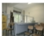
Laboratorio di Scienze

VALORIZZAZIONE DELLE ECCELLENZE CONCORSO LETTERARI, CERTIFICAZIONE LINGUISTICHE, GARE SPORTIVE.