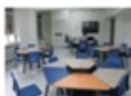
Laboratorio di Inglese